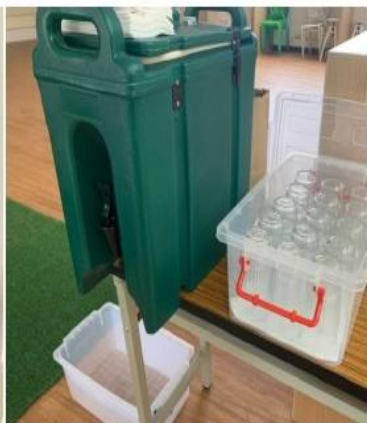
設置飲水機或桶裝水