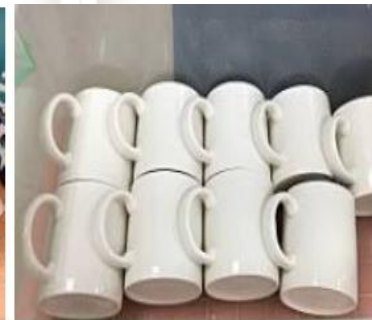
提供環保餐具盛裝