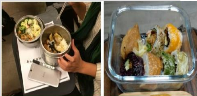
以可重複清洗餐具供餐