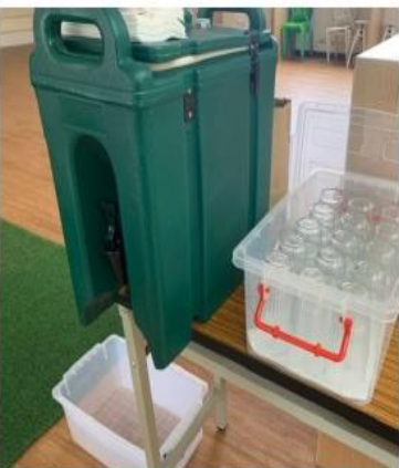
設置飲水機或桶裝水