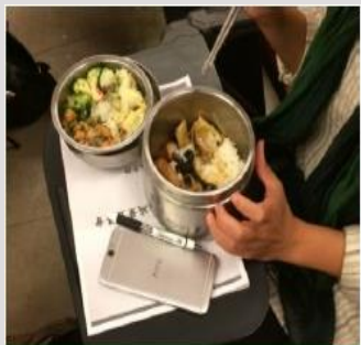
以可重複清洗餐具供餐